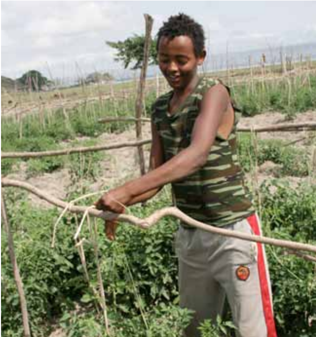
Jongere volgt praktijklessen landbouwkunde op vaktrainingscentrum.