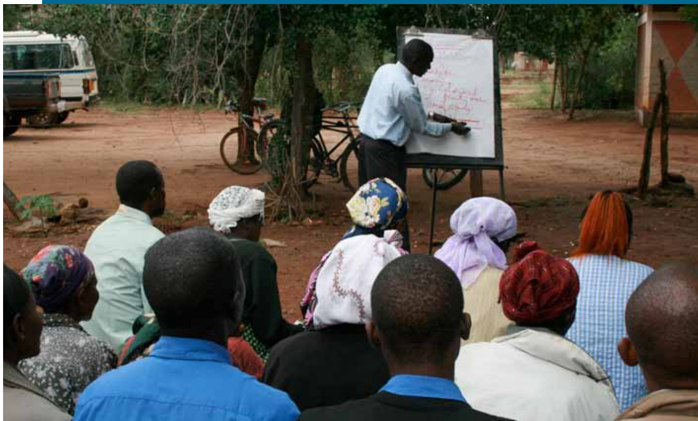
Kennisoverdracht van nieuwe landbouwtechnieken in Kenia.

Zonder uw hulp kunnen wij ons werk niet doen