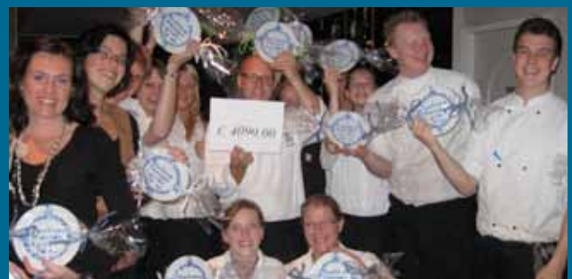
Medewerkers 'De Rijd' blij met opbrengst diner.

Hiervoor is veel geld nodig en via dit diner hopen eigenaren en medewerkers van De Rijd hieraan een bijdrage te leveren.