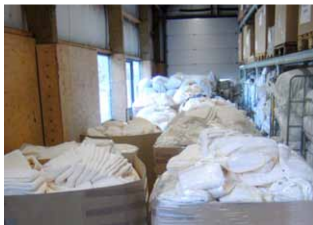
Baby- en kinderdekens van Rentex Floron in Dorcas-loods.