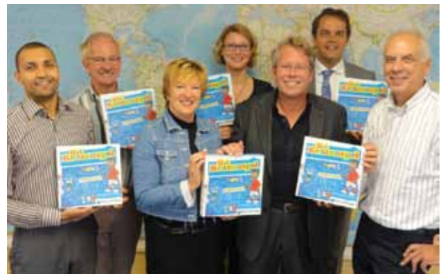
Westfrieze ondernemers presenteren het nieuwe Keezenspel.

De prijs per spel bedraagt 17,95 euro. Het spel is zeer geschikt om weg te geven, als relatiegeschenk, voor in een kerstpakket of gewoon als cadeau voor bijvoorbeeld de komende feestdagen. Meer informatie over de spelregels, de verkooppunten en de sponsoren leest u op www.hetkeezenspel.nl .