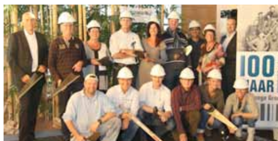
De dertien geselecteerde werknemers (met helm), klaar voor Kenia.

Vanwege het honderdjarig bestaan zijn medewerkers van Ter Steege Bouwbedrijf van 31 oktober tot en met 6 november 2011 op bouwreis geweest naar Kenia. Voor dit maatschappelijke project konden alle medewerkers van de Ter Steege Groep zich aanmelden door een goede motivatie te schrijven. Uiteindelijk zijn dertien medewerkers gekozen die de handen uit de mouwen hebben gestoken in Kenia. Deze medewerkers hielpen mee met het bouwen van twaalf woningen in Wikivuvwa. Met deze jubileumactie hoopt Ter Steege de leef- en hygiënische omstandigheden van twaalf kwetsbare families aanzienlijk te verbeteren. Lees meer op www.tersteegewaarbenijj.nu .