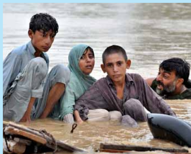
Enorme overstromingen door zware regenval.

Dorcas ontving vorig jaar van veel bedrijven en ondernemers een bijdrage voor de noodhulp in Pakistan. Hartelijk dank daarvoor! Nu, een jaar later, kunnen wij u een rapportage aanbieden waarin de ontvangsten en de bestedingen worden verantwoord van de vier gezamenlijke hulporganisaties. Door het lezen van dit rapport krijgt u een goed beeld van wat er tussen augustus 2010 en juli 2011 is gebeurd. Wilt u deze rapportage ontvangen? Stuur dan een e-mail naar bedrijven@dorcas.nl .