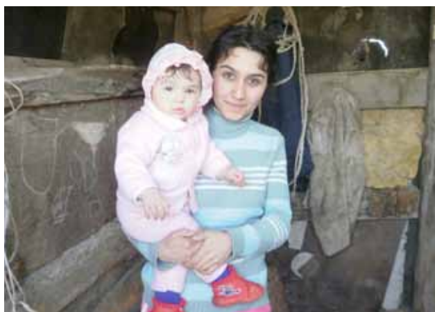
Moeder met kind in Oost-Europa krijgt hulp van Dorcas.

Dorcas heeft een lijst samengesteld van goederen die ingezameld kunnen worden om de projecten in het buitenland te ondersteunen. De inzamellijst voor bruikbare goederen vindt u op onze site www.dorcasenbedrijven.nl . Wilt u een partij aanbieden of hebt u goederen die niet op deze lijst voorkomen, maar wel goed bruikbaar zijn voor hulpverlening, neem dan contact op met Teun Welvaart, contactpersoon hulpgoederen: e-mail: t.welvaart@dorcas.nl of tel. 0228 595900.