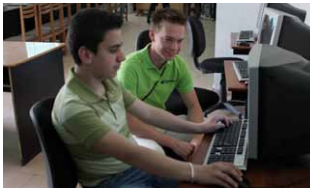
Een NCOD-medewerker bezoekt het Job Business Centre.

Het NCOD wil bijdragen aan een goed functionerend openbaar bestuur en dienstverlenende sector. De organisatie gelooft in een resultaatgerichte werkwijze bij overheidsdiensten en dienstverlenende organisaties. Het NCOD wil dicht bij de klanten staan en samen investeren om tot goede resultaten van werkzaamheden te komen.