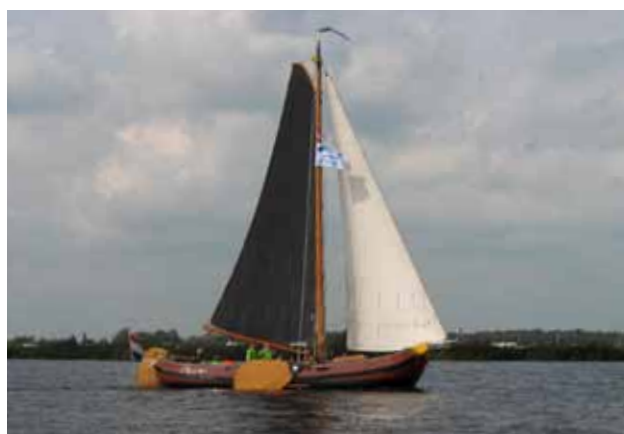
Ondernemers Fryslân zeilen voor Dorcas-project.

Na een prachtige vaartocht en een heerlijke maaltijd was het tijd voor de veiling. Sander de Rouwe, Tweede Kamerlid voor het CDA, nam de rol van veilingmeester op zich. Met de nodige humor en vindingrijkheid wist hij de deelnemers enthousiast te maken voor de kavels die werden geveild. Na de veiling maakte notaris Swart de uitslag bekend: 9.585 euro, een prachtig resultaat dat spontaan door één van de deelnemers werd afgerond op 10.000 euro.