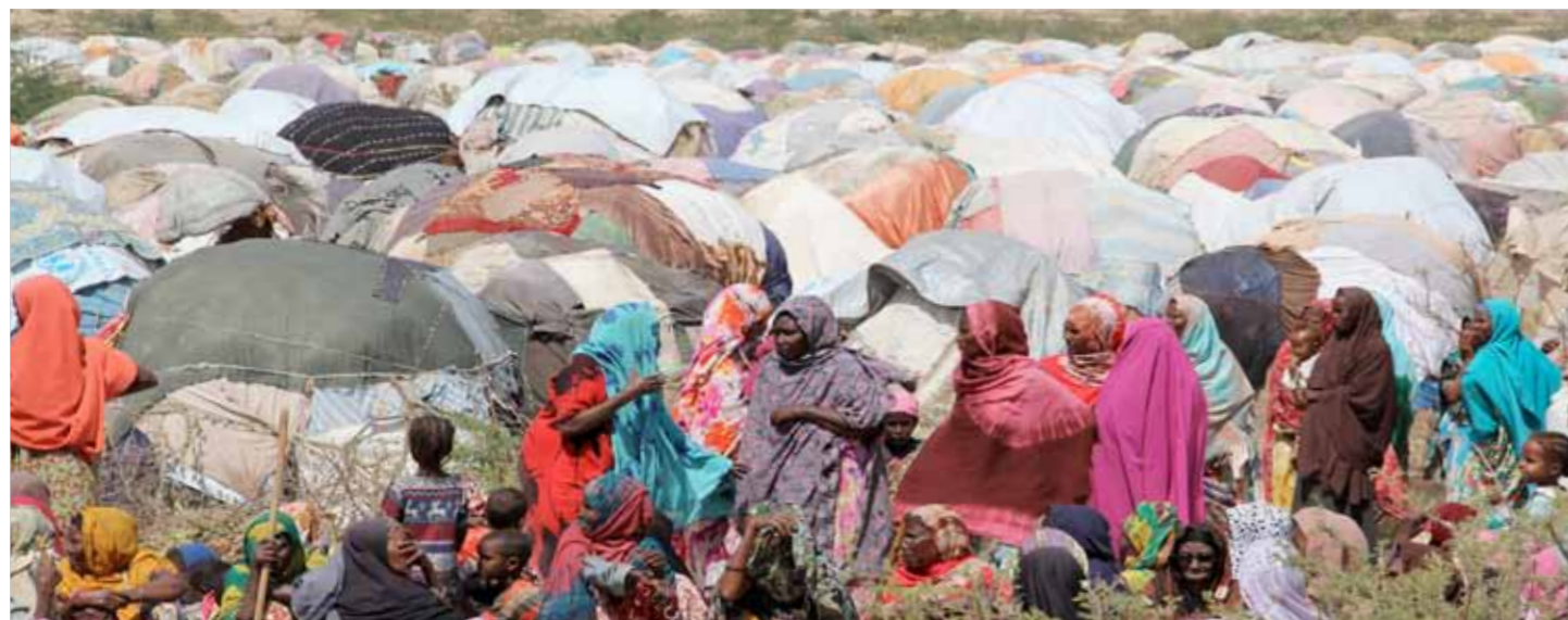
Somalilanders bij hun primitieve hutjes in het vluchtelingenkamp.