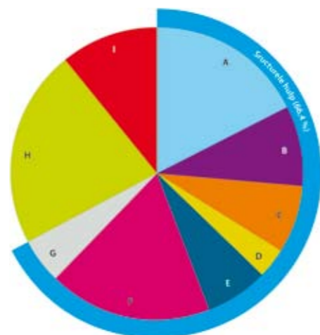
Verdeling van projecten in 2009