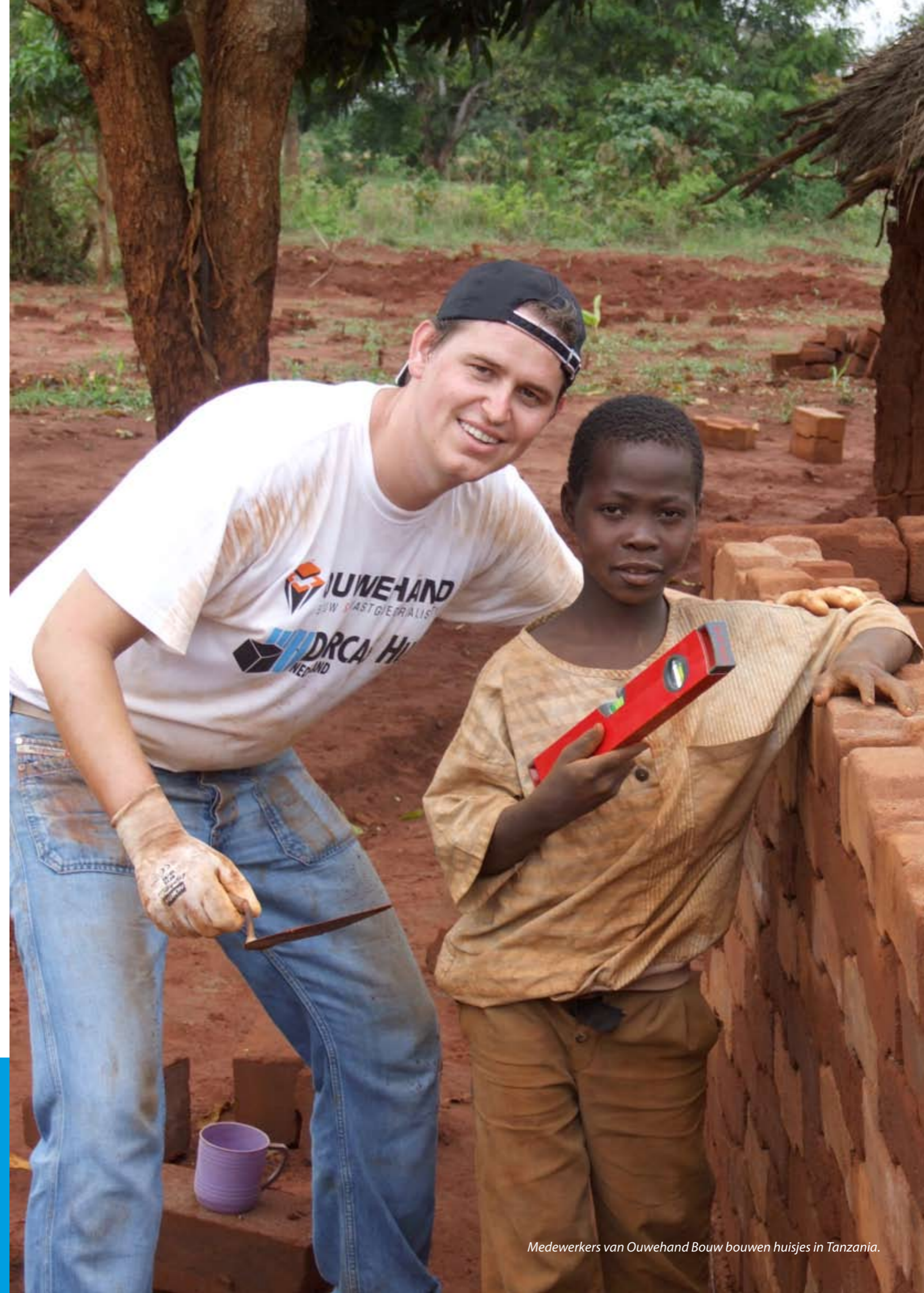
Medewerkers van Ouwehand Bouw bouwen huisjes in Tanzania.

In het kader van haar honderdjarig bestaan organiseerde gymvereniging UDI NEA uit Hensbroek een koprolrace voor Dorcas. Kinderen in de leeftijd van vier tot twaalf jaar deden mee aan de race en lieten zich per koprol sponsoren. Er werd ruim 780 euro opgehaald voor een Dorcas-project in Tanzania.