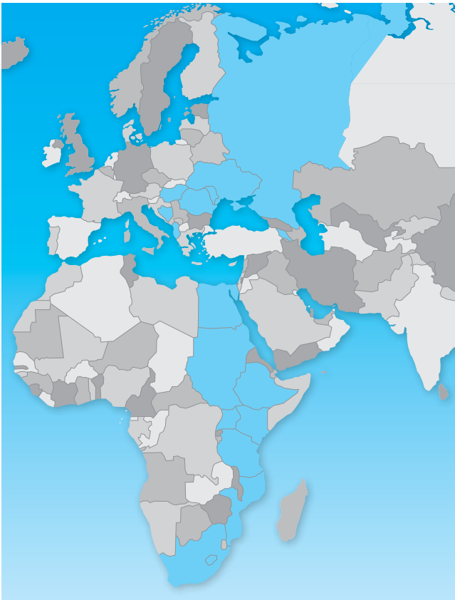
Dorcas ondersteunt projecten in achttien landen in Oost-Europa en Afrika.